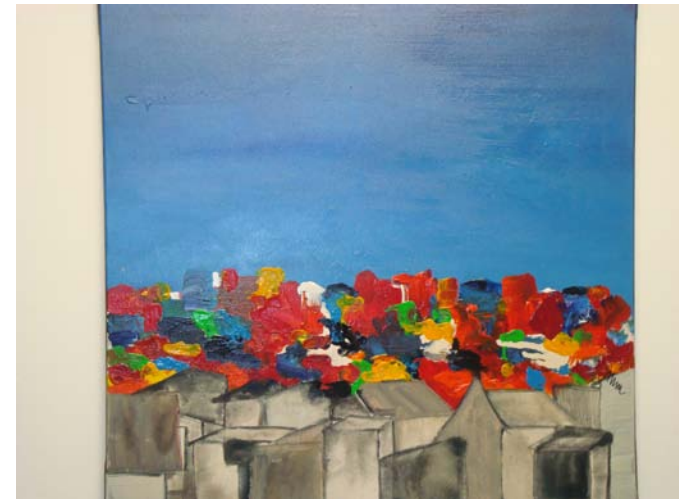
Abb. 1+2: Bilder der Künstlerin Margit Michetschläger Zum Thema "Jesus in Passau"